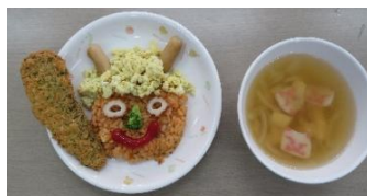
すまし汁も鬼がういてるよ～