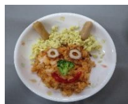
髪がふさふさだね！